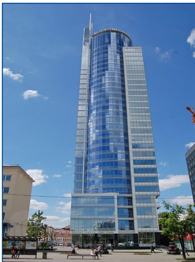
Бизнес-центр «Royal Plaza» 2014 года постройки!

В шаговой доступности станция метро «Немига», пересечение различных линий общественного транспорта по пр. Победителей и ул. Немига, высокая интенсивность пешеходного движения и шаговая доступность – все это сочетает в себе местоположение «Royal Plaza»!