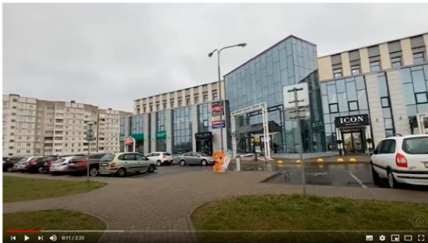
СНЯТ В ГОРИЗОНТАЛЬНОМ ПОЛОЖЕНИИ

Прилагаем наглядный пример готовых видеообзоров, снятых в двух вариантах – горизонтально и вертикально. Согласитесь, горизонтальный видеообзор выглядит профессионально, в отличие от вертикального.